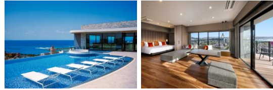
写真左インフィニティプール、写真右客室

那覇空港から車で約35分、人気観光地「アメリカンビレッジ」の新しいランドマーク。全室40平方m以上、最上階にインフィニティプールを備えた、海・空・街が煌めくりゾートです。