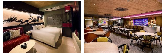
写真左客室、写真右ダイニング

通天閣のある新世界や裏なんば、日本橋エリアが徒歩圏内にある大阪観光にぴったりのホテル。ゆとりのあるツインルームを中心に構成し、個性的な大阪カルチャーを発信します。